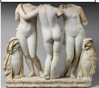
Figura 03: Escultura Três Graças