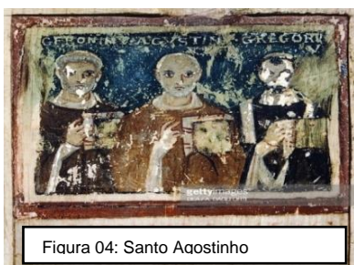
Figura 04: Santo Agostinho

Também, destacamos a obra do filósofo romano que mais influenciou o pensamento estético posterior foi Santo Agostinho. Portanto, Agostinho fazia uma distinção entre beleza sensível e beleza inteligível, e por viver no final do Império Romano, ele assumiu os princípios estéticos antigos. Sua filosofia é, de certo modo, o coroamento da estética clássica. Seus conceitos sobre o tema estão espalhados em várias obras suas. A origem da beleza está na bondade do criador, e isso pode ser atestado pela bela ordem das coisas na natureza e a beleza das proporções do Universo, que foi feito com peso, número e medida (COSTA, 2017).