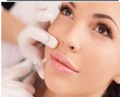
Figura 05: experiências estéticas