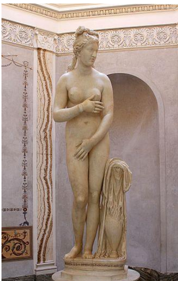
Figura 02: Escultura Afrodite

Fonte: Venus Capitolina (c. 140-160 a. C.), Museus Capitolinos, Roma